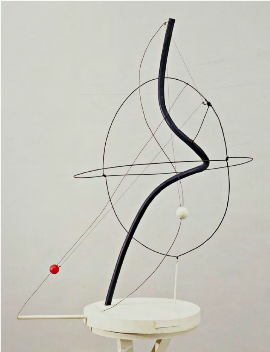
Alexander Calder Universe , 1934