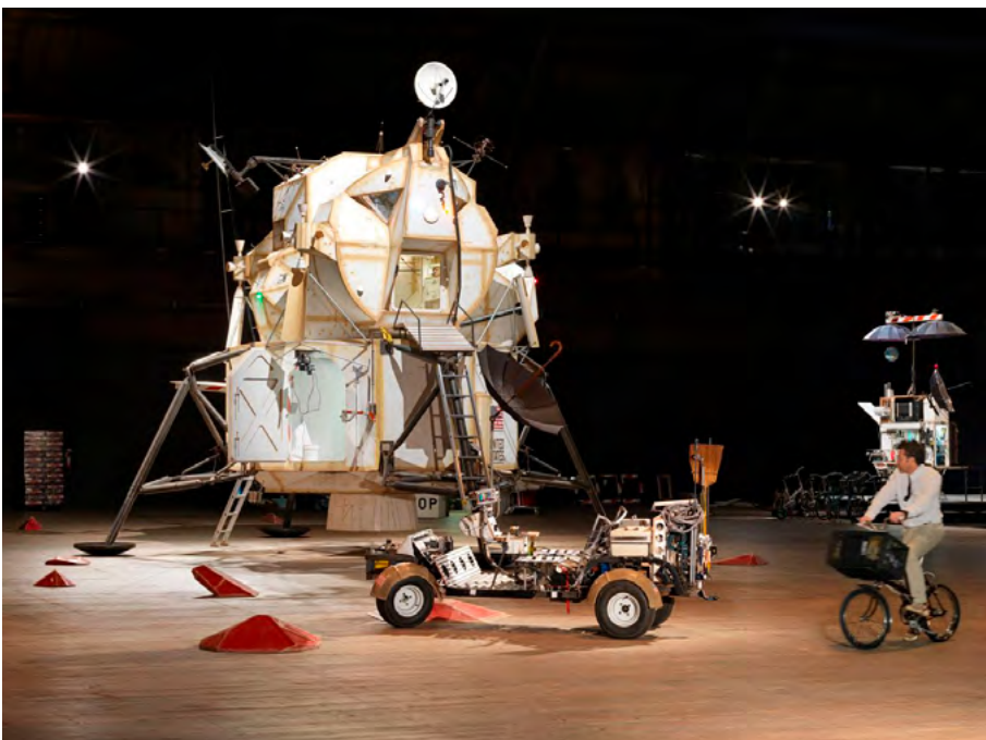
Tom Sachs Space Program , 2007