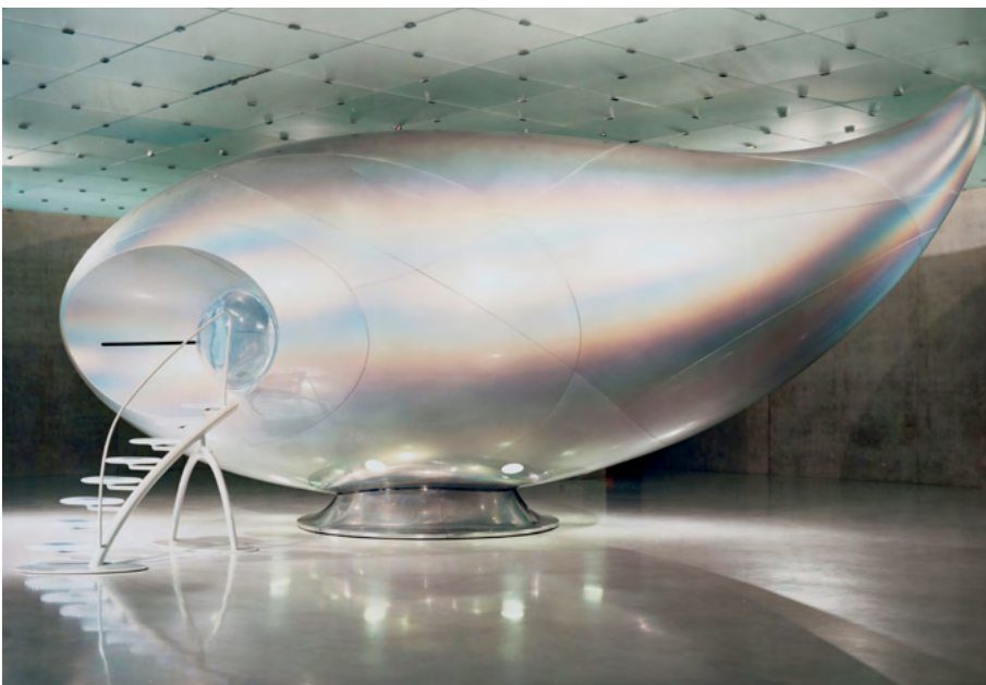
Mariko Mori Wave UFO, 1999